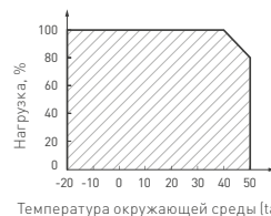
Рис. 3. Максимальная допустимая нагрузка, % от мощности источника.