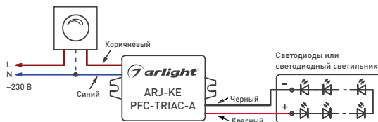
Рис. 1. Подключение источника тока.

ВНИМАНИЕ! Не допускается подключение светильника к работающему драйверу. Это может привести к отказу светильника.